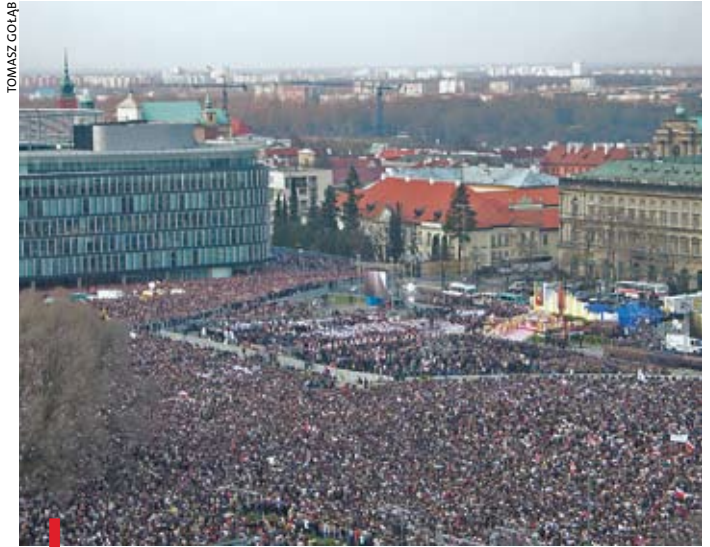
Plac Piłsudskiego jest najbardziej prawdopodobnym miejscem beatyfikacji ks. Jerzego

ści wszystkich ruchów i wspólnot diecezji. Już mamy ich żywy odzew: członkowie Odnowy w Duchu Świętym chcą na przykład przeprowadzić tydzień przed uroczystościami uliczną ewangelizację, podczas której osobiście będą zapraszać spotkanych ludzi do przybycia na uroczystości beatyfikacyjne. Ruchy z pewnością będą też obecne w wigilijnym wieczorze czuwania i koncercie w świątyni Opatrzności Bożej