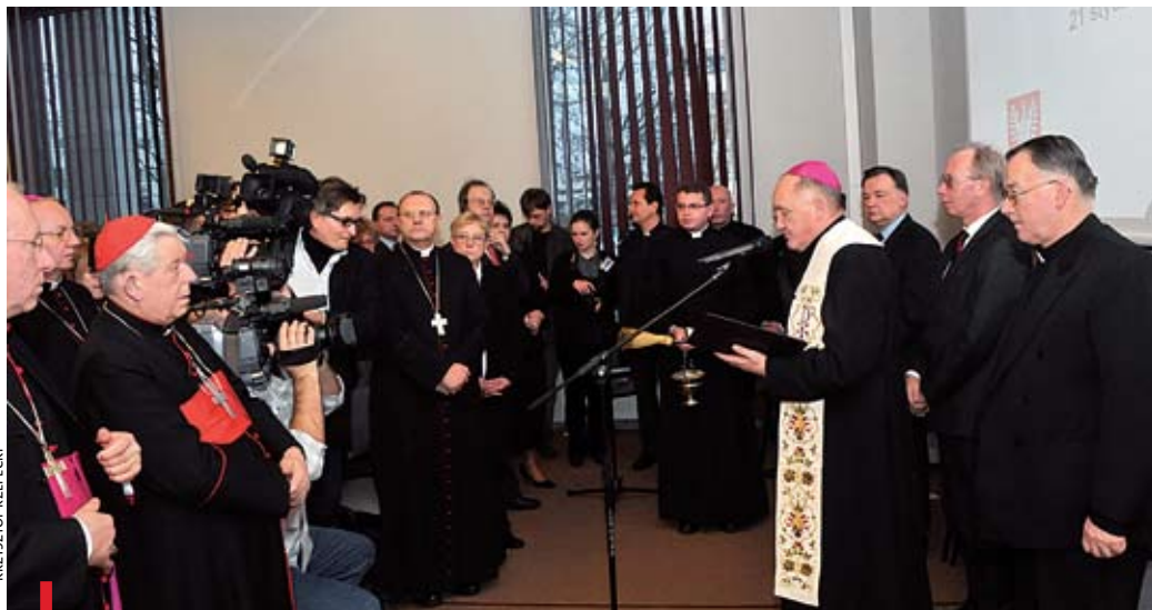
Instytut ma badać pontyfikat Jana Pawła II z perspektywy Mazowsza i papieskich pielgrzymek, z których prawie wszystkie miały swój etap warszawski

Centrum zajmuje się m.in. organizacją Dnia Dziękczynienia, budową Muzeum Jana Pawła II i kard. Stefana Wyszyńskiego oraz pozyskiwaniem środków finansowych. W ubiegłym roku zebrano niemal 75 mln zł. bf