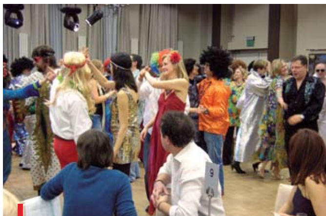
PONAD STO PAR BAWIŁO SIĘ 23 STYCZNIA NA ABBA BALU.

Bal, zorganizowany przez środowisko szkół i przedszkoli Stowarzyszenia Sternik, odbył się w jednym z podwarszawskich hoteli. Dochód z loterii, na którą fanty przekazał również „Gość Niedzielny”, został w całości przeznaczony dla powstającego Hospicjum Dziecięcego „Promyczek” w Otwocku.